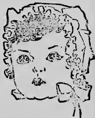
Baby has improved a great deal... on